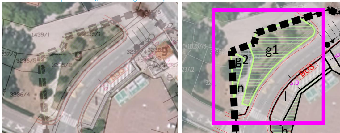
Tablica 5: Prikaz izmjena na GČ „n“ na kartografskom prikazu 4 UVJETI GRADNJE

Ovim izmjenama i dopunama na građevnoj čestici „n“ planira se uređenje pješačke površine od škole na sjeveru prema cesti uz parkiralište na jugu na, sve smješteno sa zapadne strane parkirališta Milihovo. Planom se utvrđuje čestica za pješačku površinu – stube koje su već izvedene i uređene.