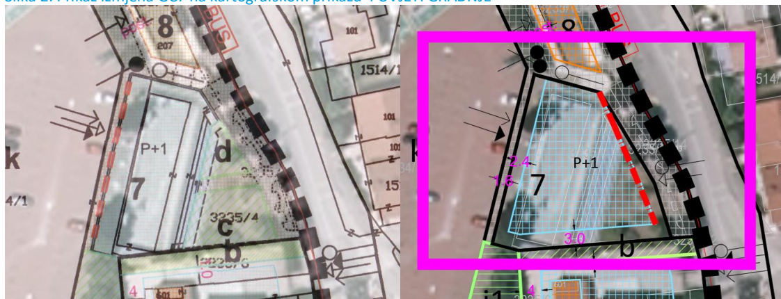
Slika 2: Prikaz izmjena GČ7 na kartografskom prikazu 4 UVJETI GRADNJE

Područje na kojem se sada nalazi boćalište predstavlja sam centar naselja. Nalazi se uz ostale javne sadržaje (školu, općinsku zgradu, vrtić) te je intencija ovog Plana redefiniranje centra i stvaranje novih javnih i društvenih sadržaja. Planira se nova građevina na mjestu boćališta koja bi stvorila novo ulično pročelje s istočne strane parkirališta, prema glavnoj prometnici, s tim da visina prema glavnoj ulici ne prelazi jedan kat. Planira se građevina suvremenog arhitektonskog izričaja koja bi svojom formom doprinijela stvaranju poboljšanje slike naselja, a funkcijama omogućila sadržaje koji naselju nedostaju.