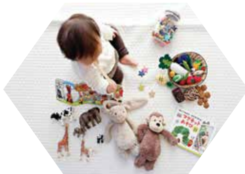
Izgradnja nove zgrade Dječjeg vrtića Viškovo