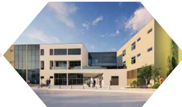
Izgradnja nove OŠ Marinići