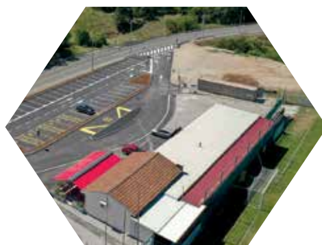
Rekonstrukcija objekta NK Halubjan