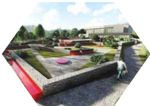
Kuća halubajsega zvončara