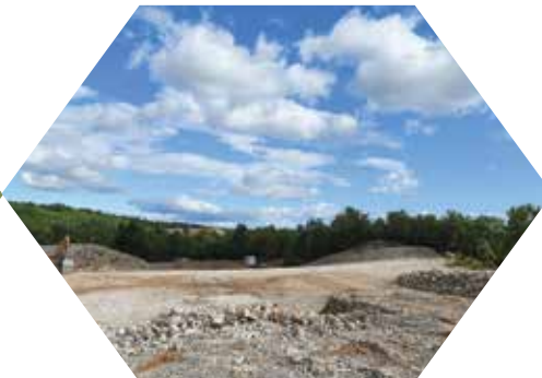
Nova Radna zona Mariščina