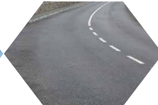
Rekonstrukcija ceste Vozišće – Mavri