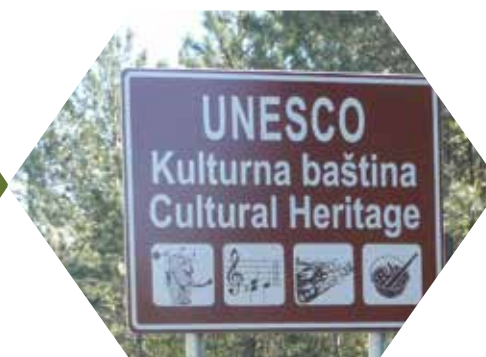
Interpretacijski centar Ronjgi