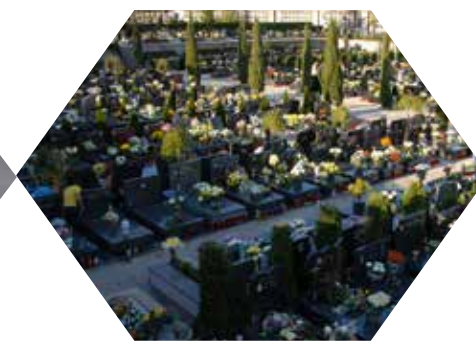
Izgradnja novog groblja Viškovo – Kastav